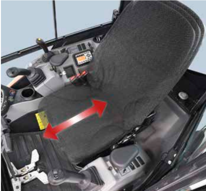
Bequemer verstellbarer Fahrersitz

Der Platz in der Kabine ist komfortabler als bei jedem anderen Bagger dieser Klasse, und die zahlreichen praktischen Leistungsmerkmale bieten dem Fahrer maximalen Komfort.