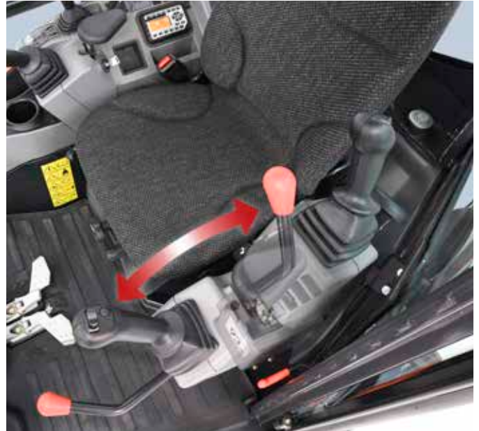
Kippfunktion im Leitstand